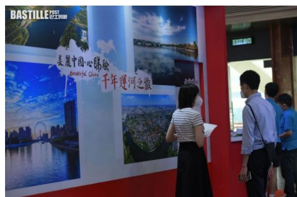
過百家參展商來自包括內地、澳門、台灣等。

過百家參展商來自包括內地、澳門、台灣、南韓、加拿大、俄羅斯、泰國等，而向來是港人旅行熱點的日本有超過10個地區及縣市參與。