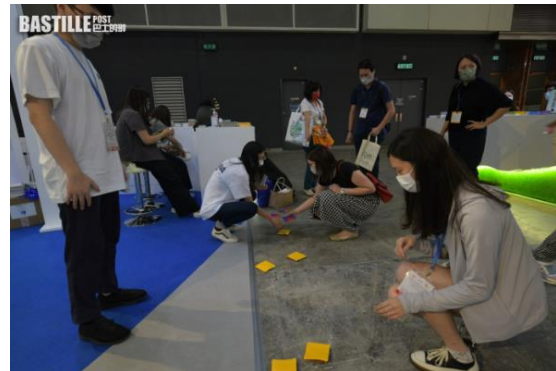
首日展覽只接待業界人士，周五下午起開放給公眾。

韓國觀光公社香港支社指，南韓由上月起，對港人放寬免簽證、免檢疫的措施，接獲的旅遊查詢有所上升，加上港府實施「3+4」檢疫模式後，訪韓人數由6月的600多人增至本月逾2000人，期望兩地旅遊業得以逐步復甦。