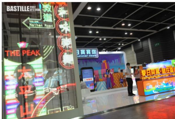
除了外地的參展商，也有旅遊發展局、旅遊業議會及本地遊商戶參展。

新冠疫情持續兩年多，港人已經無外遊多時。第36屆香港國際旅遊展於18日起，一連四日在灣仔會議展覽中心舉行。首日展覽只接待業界人士，周五下午起開放給公眾，市民可以了解各地最新景點及旅遊資訊。今屆展覽有來自27個國家及地區、逾百家參展商參與，較去年增加約5成。