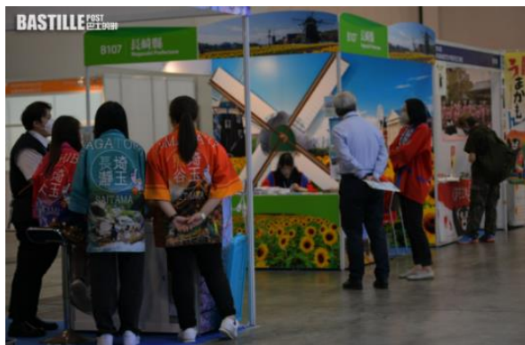
向來是港人旅行熱點的日本有超過10個地區及縣市參與。

主辦方指，今年整體主題是「復聯和復甦」，希望為旅遊業界不同的持份者，提供一個便利的場合彼此恢復聯絡，從而推動旅業復甦。今年參展的地方較去年多50%，相信與港人外遊數字逐步增加有關。又指檢疫酒店令旅遊段時間及成本大增，又令旅客盡情玩樂後回港難以接受，「3+4」令上班族也更容易安排。