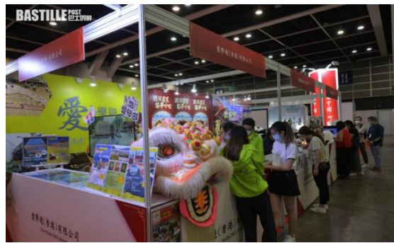
過百家參展商來自包括內地、澳門、台灣。

不過旅遊業議會表示，旅行社一直有做準備恢復外遊，但航空公司的載客量未能配合，機位少導致機票貴從而團費高企，相信機票及團費價格短期內都不會回落。