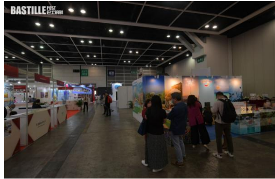
過百家參展商來自包括內地、澳門、台灣等。