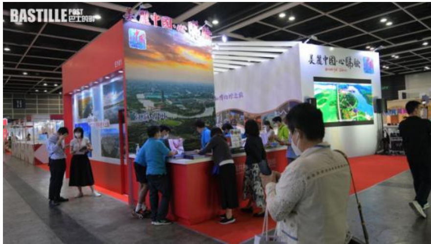
第36屆香港國際旅遊展由18日起，一連四日在灣仔會議展覽中心舉行。