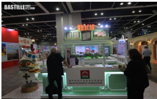
過百家參展商來自包括內地、澳門、台灣。

韓國觀光公社香港支社指，南韓由上月起，對港人放寬免簽證、免檢疫的措施，接獲的旅遊查詢有所上升，加上港府實施「3+4」檢疫模式後，訪韓人數由6月的600多人增至本月逾2000人，期望兩地旅遊業得以逐步復甦。