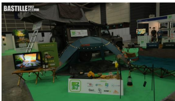
本地商戶都有參與。

不過旅遊業議會表示，旅行社一直有做準備恢復外遊，但航空公司的載客量未能配合，機位少導致機票貴從而團費高企，相信機票及團費價格短期內都不會回落。