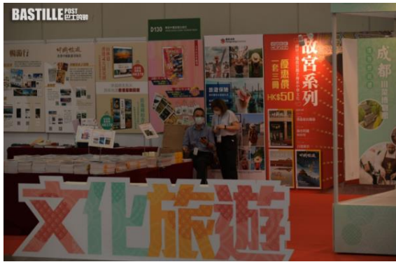
過百家參展商來自包括內地、澳門、台灣等。