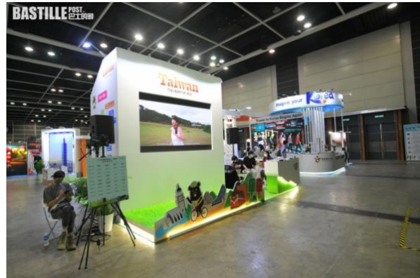
今屆展覽有來自27個國家及地區、逾百家參展商參與。

主辦方指，今年整體主題是「復聯和復甦」，希望為旅遊業界不同的持份者，提供一個便利的場合彼此恢復聯絡，從而推動旅業復甦。今年參展的地方較去年多50%，相信與港人外遊數字逐步增加有關。又指檢疫酒店令旅遊段時間及成本大增，又令旅客盡情玩樂後回港難以接受，「3+4」令上班族也更容易安排。